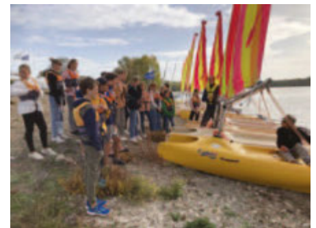
Klasse 7: kleiner Segelkurs auf 2er Katamaranen

Wenn Sie noch mehr Einblicke möchten, schauen Sie auch gerne auf unserer Homepage www.fes-muellheim.de oder auf unserer Instagramseite fes-muellheim vorbei.